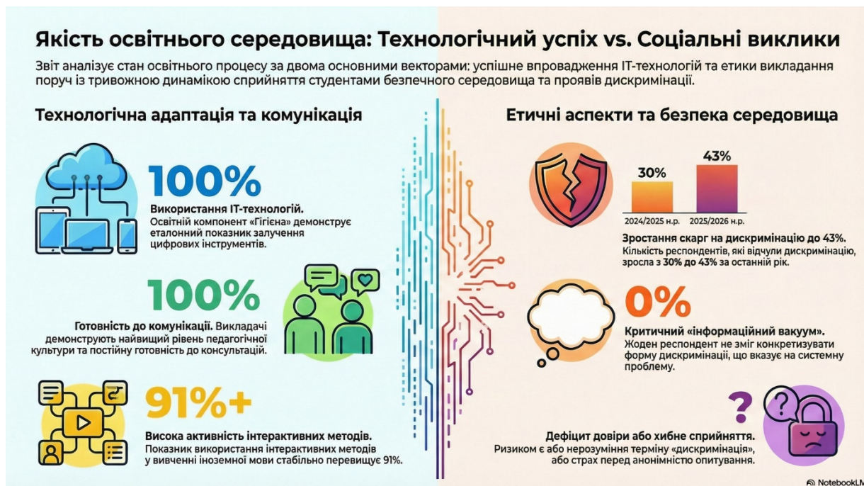
Порівняльна таблиця ключових змін

Рівень задоволення якістю викладання зріс з ~90% (де були оцінки «задовільно» та «незадовільно») до 100% оцінок «відмінно» та «добре» у 2025/2026 році.